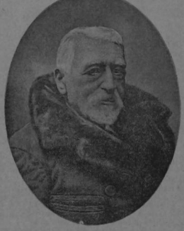
Don Eugenio Montero Ríos

Falleció en Madrid don Eugenio Montero Ríos, notable abogado y político español. Figuró en la revolución del 68 y 69, que destruyó a Isabel II. Luego en las Cortes constituyentes. También en el Gobierno provisional. Enseguida en la restauración Alfonsina, al lado de Sagasta, como Ministro en diversos departamentos. A la muerte de Sagasta se hizo cargo de «La Derecha Liberal» partido que también se llamó «Monteristas». Fue Montero Ríos el que firmó en París en 1898 el tratado con los yankees, cuando la pérdida de las colonias españolas. Fue éste el primer caso de su vida política, pues la juventud española nunca perdonó este paso al ilustre difunto. Falleció a muy avanzada edad, siendo Presidente del Senado.